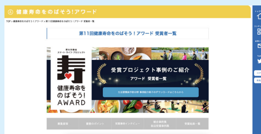
スマート・ライフ・プロジェクトウェブサイト