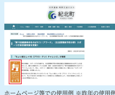
ホームページ等での使用例 ※昨年の使用例