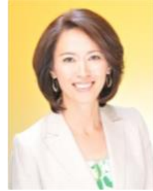
元女子マラソン選手/ いきいき健康大使 有森裕子氏